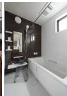
| Bath |