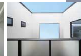
| Inner Balcony |

※掲載の写真には、一部標準仕様でないものが含まれています。また、家具・調度品・電化製品・植栽等は含まれておりません。※画像はイメージです。