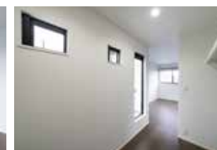
| W.I.C. |