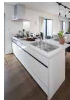
| Kitchen |