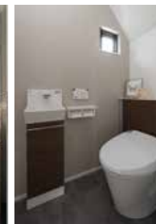
| Toilet |