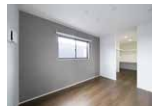
| Bedroom |