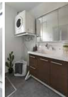
| Powder Room |