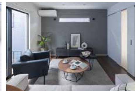
| Living |